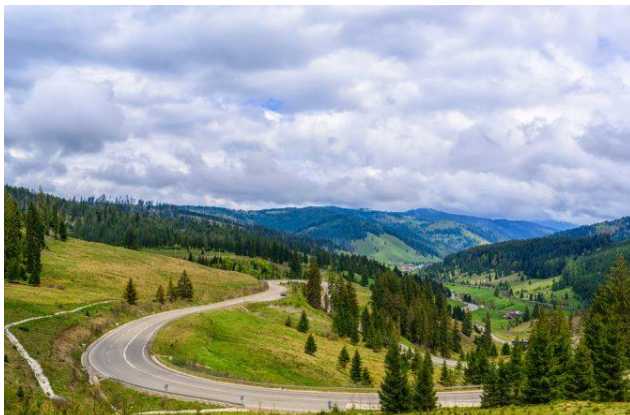
Paysage sur le route vers Campulung