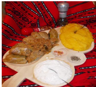
plat traditionnel roumain