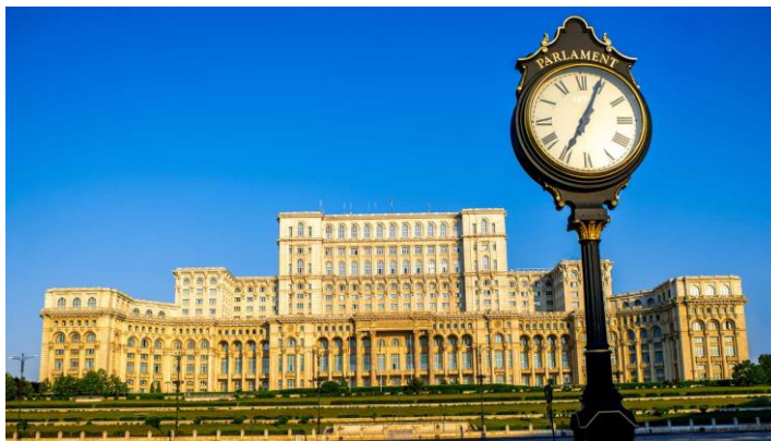
Palais du Parlement