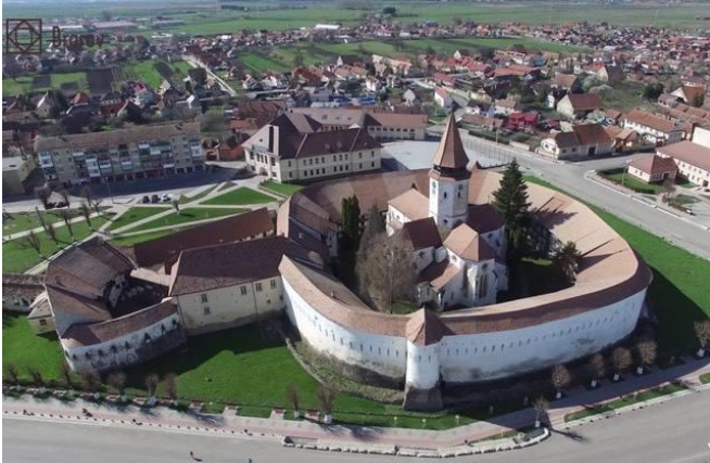
L'église fortifiée Prejmer

Ensuite route vers Bran et visite du célèbre château médiéval construit sur un rocher par les habitants de Brasov en 1377 pour défendre leur ville. Vlad a utilisé ce château comme quartier général pour ses incursions en Transylvanie. En 1922, la reine Marie le transforma en résidence d'été. Depuis quelques années, c'est un beau musée d'art médiéval. Retour à Brasov. Dîner libre a Brasov.