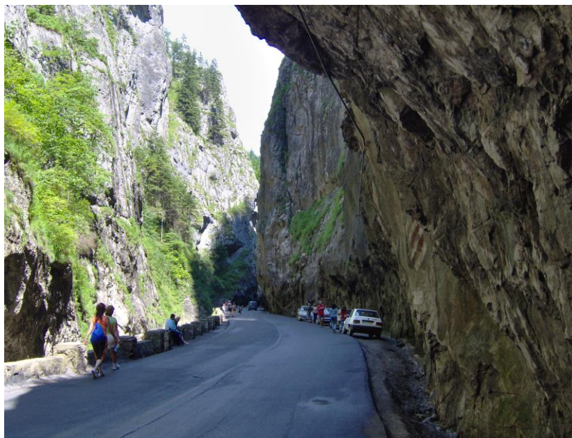
Gorges de Bicaz