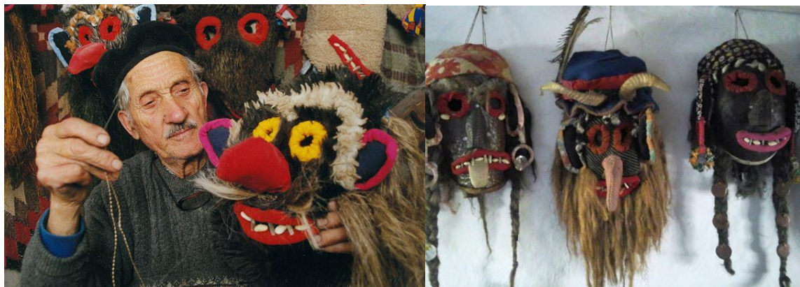
Creation de masques populaire