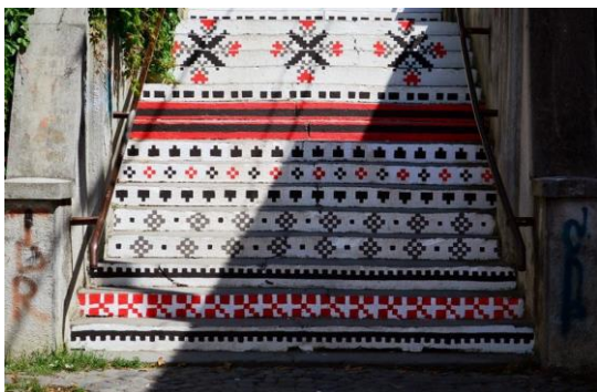
Targu Mures Bistrita