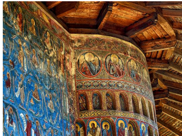
Sixtine de l'Orient