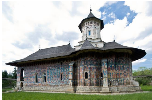
monastere de Moldovita