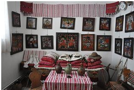
Musée des icônes sur verre

Départ vers Sibi où vous visiterez le musée des icônes sur verre. Dîner avec des plats typiques à volonté (choux farcis, boulets de viande, fromage, légumes et fruits bio, apéritif – eau de vie et vin local). Nuit chez l'habitant 3 marguerite (pension REGHINA), une occasion de partager et de connaître leurs traditions et coutumes.